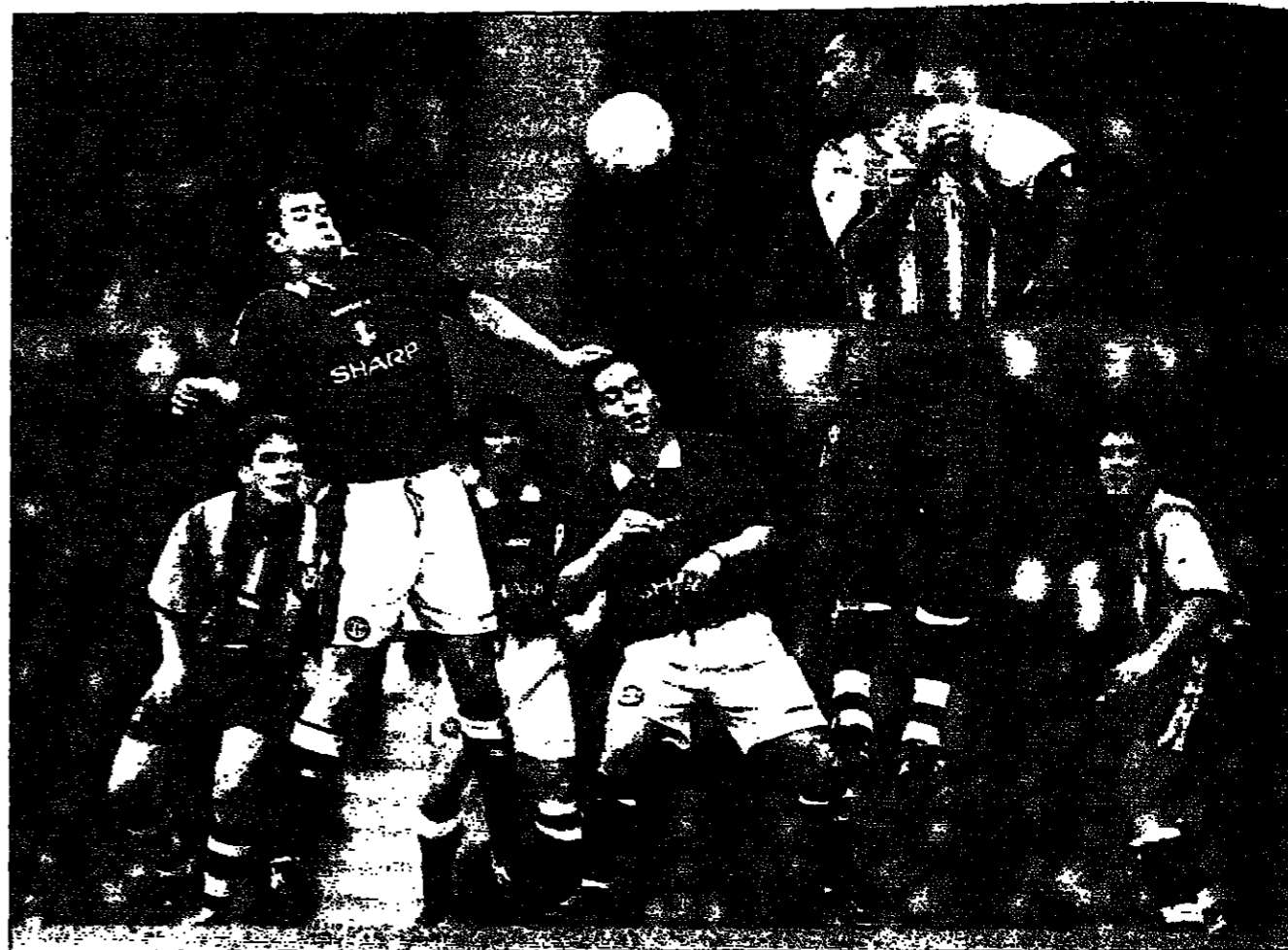
جاري بالستار لاعب مانشستر يونايتد في الكرة في فترة في الهواء